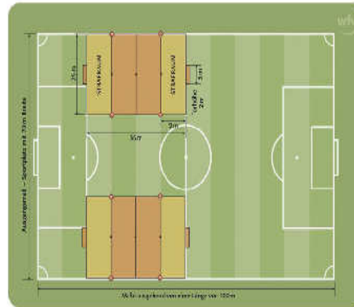
Minispielfeld für zwei tragbare Tore 5 x 2 m bzw. freie Tore